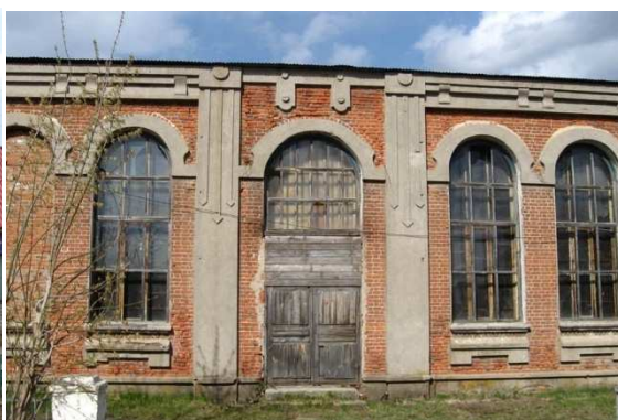
Дом купчихи Поповой