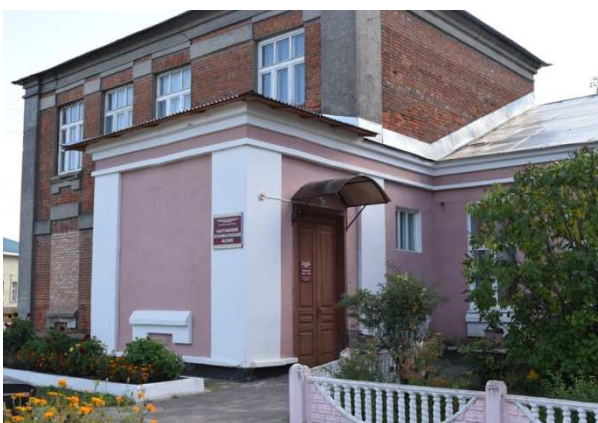
Чугунная плита из покрытия пола Ильинского храма. (Экспонат Елатомского краеведческого музея ( в здании бывш. гимназии - п.Елатьма ул. Янина д.3с 10.00 до 16.00, ежедневно кроме понедельника и последней пятницы каждого месяца.)