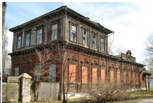
Дом Смолянинова, бывший гимназический пансион (фото 1960-х и современное)