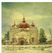
Чистяков Г.В. ХРАМЫ СЕЛА ЛОСЕВО и его история.