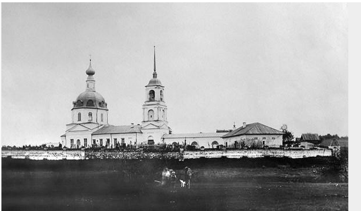
Николаевская церковь в селе Пониье