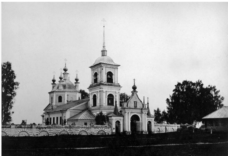
Успенская церковь в селе Солда

До середины XVIII в. здесь была Солдовская Жуково-Богородицкая пустынь. Она была основана в 1515 г. и упразднена в 1764 г. В переписи 1627 г. записано: «В волости Солда монастырь Успения Пресвятой Богородицы, Жукова пустынь на речке Вексе и речке Солде». Сохранилось описание церкви 1701 г.: «Церковь деревянная шатровая о пяти главах окольчужены лемехом, на 4-х главах кресты деревянные, да в монастыре другая теплая деревянна Рождества Иисуса Христа с двумя приделами, о трех главах, на святых воротах колокольня деревянна рублена о 8-ми стенах шатровая вверх, да на шатре глава и крест, три колокола а весу в первом 14 пудов, а два колокола увезены в Москву на Пушечный двор». Сохранилась только колокольня Успенской церкви. Четвертый ее ярус надстроен, вероятно, после 1908 года.