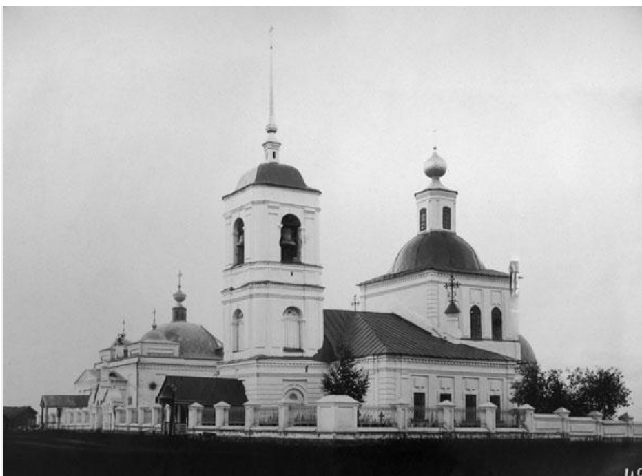
Воскресенская (Николаевская) (справа) и Покровская церкви в селе Лосево.

Церковь складывается из двухсветного четверика храма, равной по ширине апсидой, вытянутой поперёк трапезной, трёх ярусной колокольной с высоким шпилем, несущим крест. Кресты кованые в большинстве ажурные. От колокольни до ограды – паперть с двухскатной крышей на кирпичных столбах. (Подробно об устройстве храма сказано в книге: «Памятники архитектуры Костромской области». Каталог. Выпуск 4. Кострома 2002 г.).