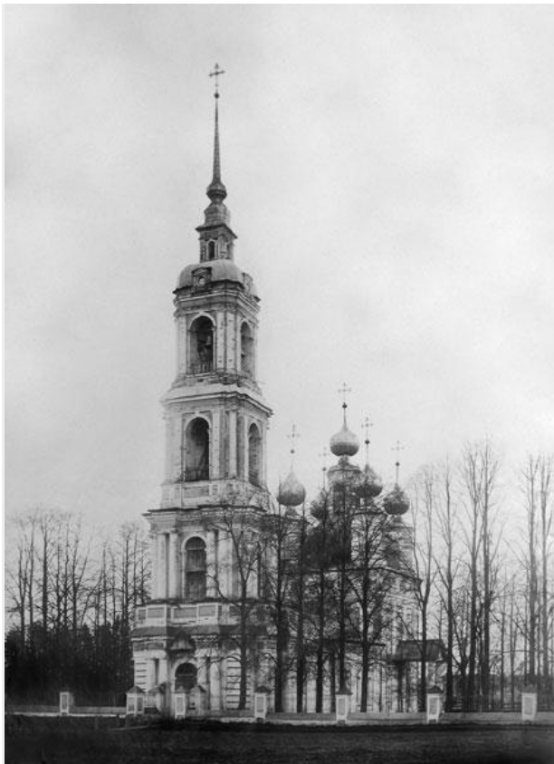
Благовещенская (Воскресенская) церковь в усадьбе Нероново

Церковь построена в 1793 г. (1790?) усердием г. Петра Ивановича Черевина. Церковь по сей день действующая. Нероново это вотчина Черевиных одних из богатейших в губернии. В семье Черевиных были моряки, адмиралы и генерал-адъютант свиты императора Александра III, и декабристы. Широко известна в стране картинная галерея художника Григория Островского. В фамильном склепе в церкви покоится прах многих владельцев усадьбы.