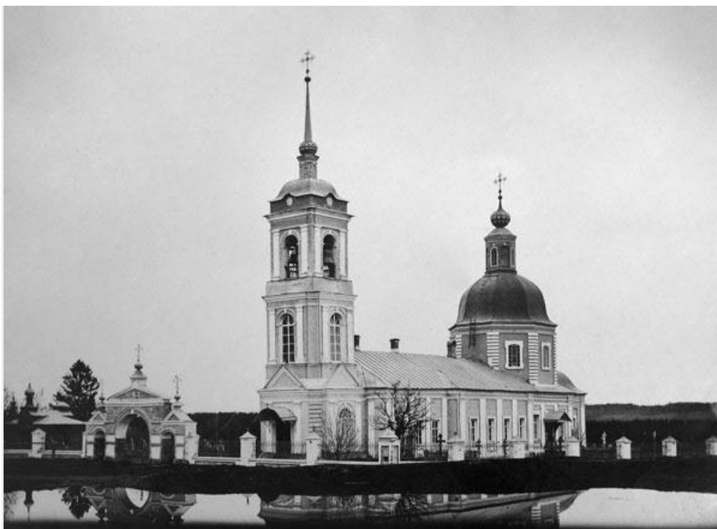
Ризоположенская церковь в селе Герасимово (Богородское)