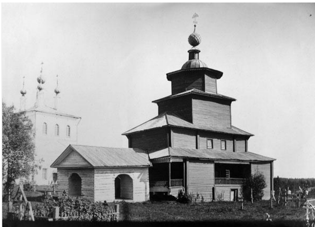
Преображенская церковь в селе Коровново

В Лосево-Раменской волости к востоку от слияния реки Вочи в Вексу с 15 века располагается Преображенский мужской монастырь (Александрова пустынь) основанный преподобным Александром Вочским. При монастыре была слободка Коровья. По переписи 1627 года в ней живут служка да служебники да двор коровий на нём коровник Лёвка Кондратьев, конюх Сидорка Онуфриев, всего 8 дворов. При монастыре две деревянных церкви Преображенская и Покровская шатровые в одной главе, да колокольня шатровая, да часовня каменная преподобного Александра, а в часовне гроб чудотворца. В 1764 году монастырь был упразднён.